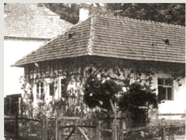
Rodný dom Ludovíta Štúra v Uhrovci

Ludovít Štúr nadobudol kvalitné vzdelanie, v ktorom sa spájali vedomosti s hodnotami hlásanými modernými ideovými smermi. Pred pohodlím súkromia uprednostnil službu vyššiemu celku – emancipácii a slobode svojho národa, modernejšej a spravodlivejšej spoločnosti. Tejto vízii zasvätil celý svoj život a zapálil za ňu aj mladú generáciu vzdelancov, ktorá dostala pomenovanie štúrovci. Táto výnimočná generácia sa postavila do čela slovenského národného hnutia v kritických momentoch európskych dejín, počas ktorých medzi sebou súperili ideály slobody a spravodlivosti so sociálnym a národným sebestvom silných. Dokázala prenášať Štúrove idey do slovenských regiónov a spochybníť maďarizačné ambície. Slovenskej spoločnosti a národnej svojbytnosti Slovákov dala silné impulzy, ktoré sa už nedali zmazať, naopak stali sa východiskom ich modernizácie a emancipácie.