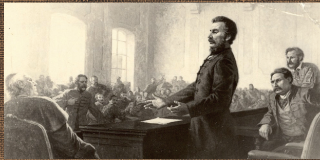
Gejza Szalay: Ludovít Štúr na uhorskom sneme.

Vytvoril príťažlivý koncept svojbytného slovenského národa a stanovil strategické nástroje na jeho upevňovanie. Z jeho okruhu vychádzali podnety na posilňovanie organizačných základov národného hnutia (spolok Tatrín, študentské spolky, regionálne vzdelávacie spolky). Bol tiež hlavným organizátorom zjednotenia konfesiónálne roztrieštenej inteligencie. Keďže hnutie nemalo k dispozícii mocenské ani finančné nástroje, Štúr ho orientoval tak, aby sa