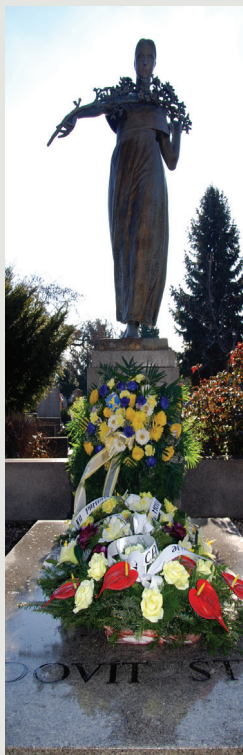
Hrob Ludovíta Štúra v Modre